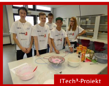
ITech 3 -Projekt